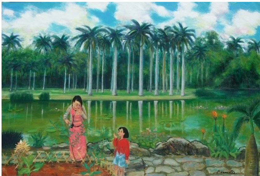
「シーサンパンナの春」F120 号